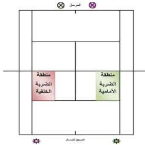
الشكل (١) منطقتي الإرسال المحددة ضمن الاختبار

- يقوم المرسل بأداء الإرسال (الإرسال بالدوران العلوي) في المنطقة المحددة من منطقة الإرسال ، كما في الشكل (١) .